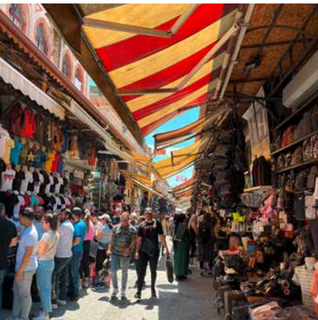
UNE RUELLE ANIMÉE DU GRAND BAZAR.

L'hôtel The Bank situé en plein cœur de la ville, à deux pas de la Tour Galata, est un véritable petit chef-d'œuvre design avec une approche luxe,