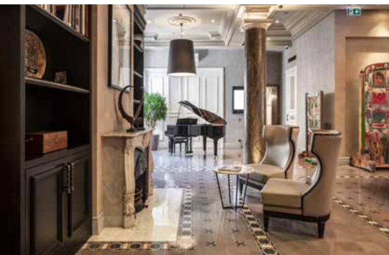
LE LOBBY ET COIN PIANO DE L'HÔTEL THE BANK.

la dextérité de notre hôte à offrir à ses clients la quintessence du confort et de l'hospitalité moderne Turque. L'agencement a été savamment étudié et réussi, des hauts plafonds, aux sols habilement carrelés, en passant par les moulures et colonnes de marbre travaillées du lobby, au bar avec son véritable coffre-fort à bouteilles. Avec l'ascenseur Art déco, ces anciennes caisses enregistreuses en repères décoratifs, mais aussi le spa et le fitness, il y a ce fil conducteur réussi où l'empreinte d'un passé se marie parfaitement au présent sans perdre le cachet du lieu, son luxe, et son architecture.