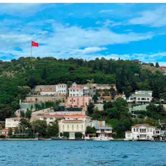
LE CHARME DE LA RIVE ASIATIQUE.