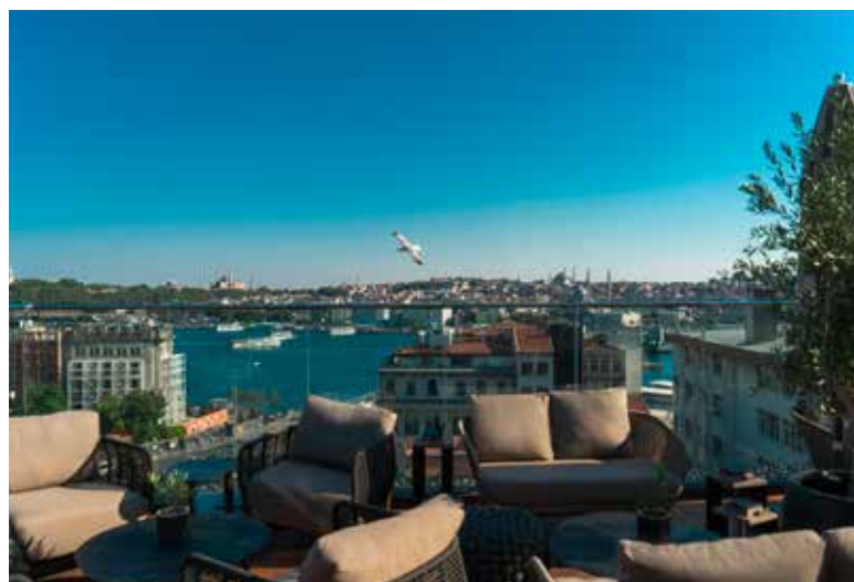
LE ROOFTOP ET SA VUE SPECTACULAIRE SUR L'HORIZON STAMBOULIOTE.