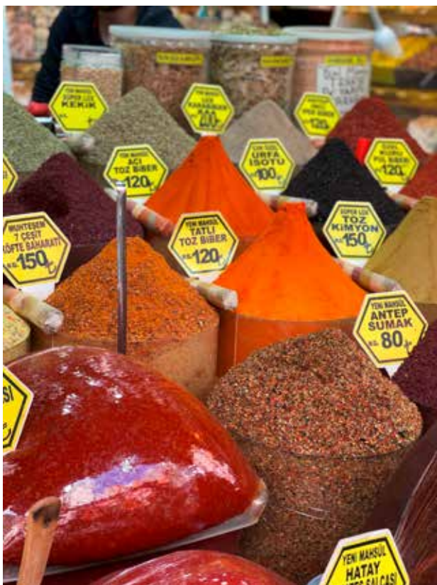
SAVEURS VOYAGEUSES AU MARCHÉ AUX ÉPICES.