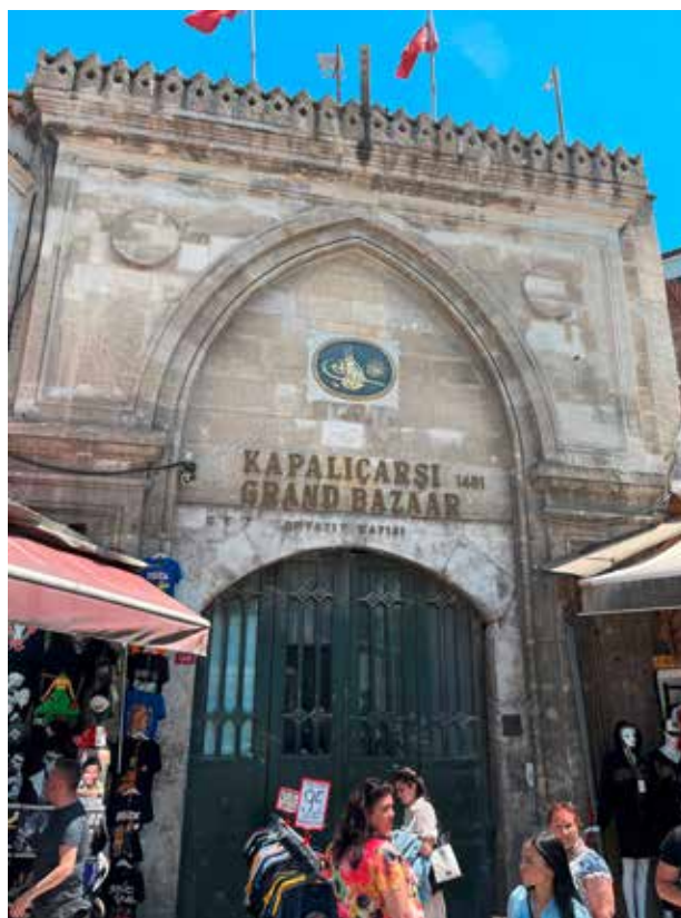
L'ENTRÉE HISTORIQUE DU GRAND BAZAR.