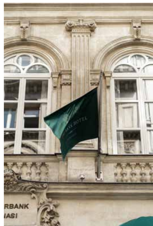
LA FAÇADE D'ÉPOQUE DE L'HÔTEL THE BANK.