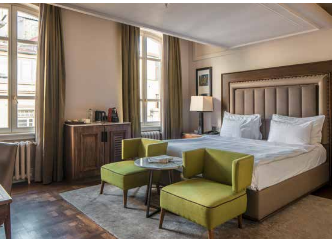
UN DES NIDS DOUILLETS.