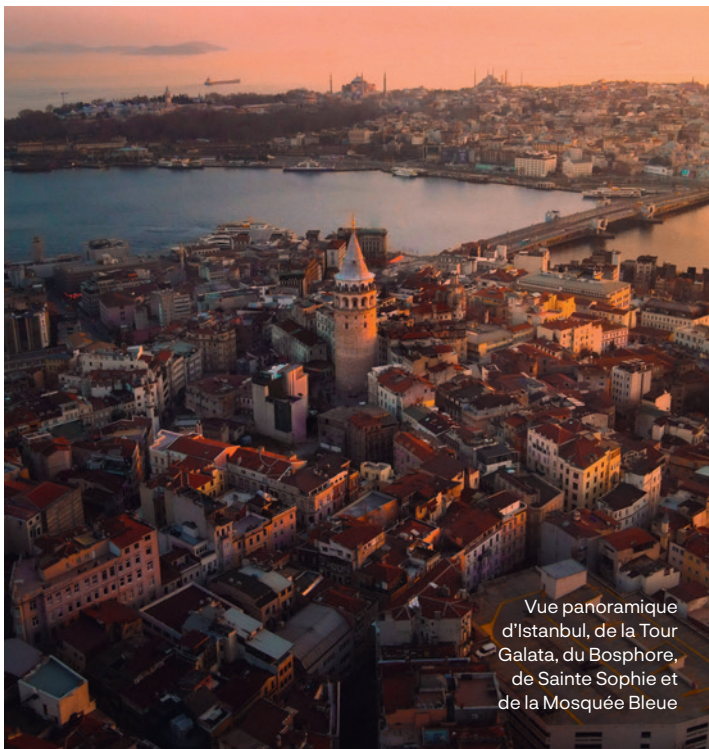
Vue panoramique d'Istanbul, de la Tour Galata, du Bosphore, de Sainte Sophie et de la Mosquée Bleue