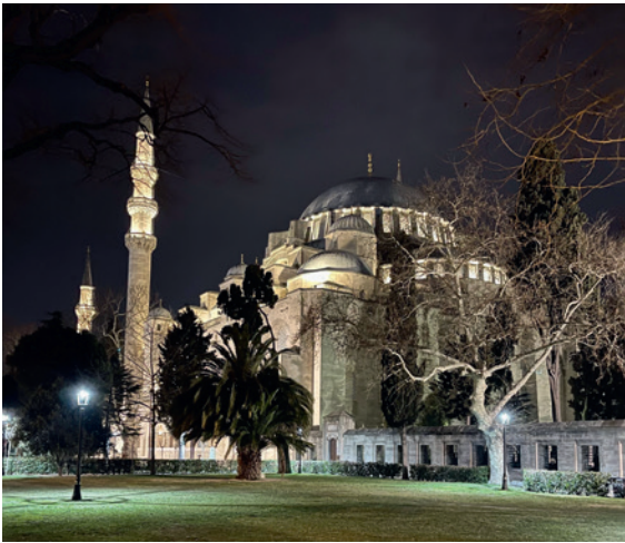
Sainte Sophie la Majestueuse dans la nuit stambouliote.

Riche en histoire et en culture, la ville offre un aperçu fascinant de l'Empire ottoman, de la culture byzantine et de la Turquie d'aujourd'hui. Rendez-vous dans l'une des villes les plus envoûtantes du monde.