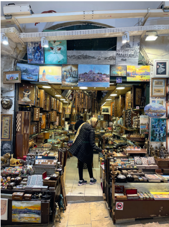
Echoppe traditionnelle dans le Grand Bazar.

Istanbul, la cité des sept collines, est l'une des véritables perles de l'Orient. Située à cheval sur deux continents, l'Europe et l'Asie, cette mégapole cosmopolite est riche en histoire, en culture et en architecture. Anciennement appelée Byzance, puis Constantinople, elle fut la capitale de trois empires successifs : l'Empire romain d'Orient, l'Empire byzantin et l'Empire ottoman. De nos jours, Istanbul est une métropole dynamique qui abrite une population diverse et animée, ainsi que de nombreux sites historiques, culturels et touristiques.