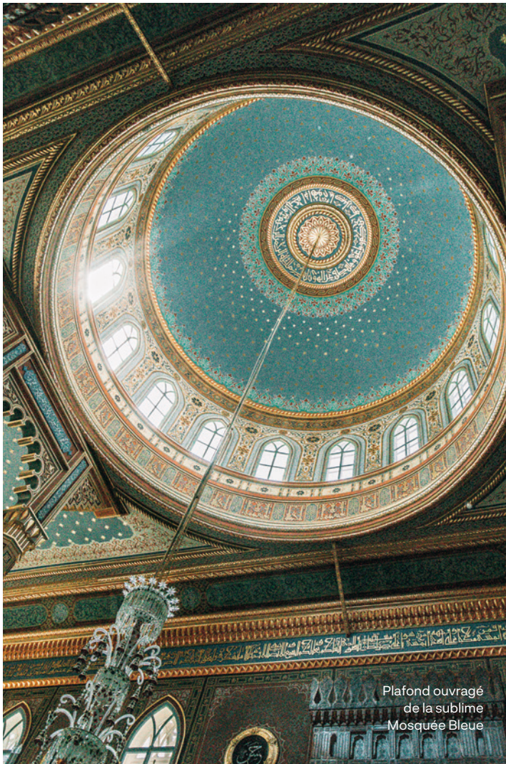
Plafond ouvragé de la sublime Mosquée Bleue